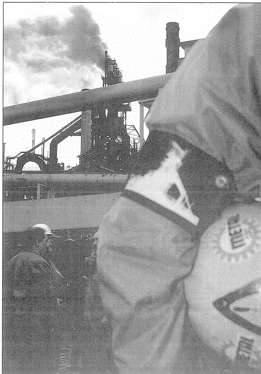
Liège affiche un PIB par habitant de 85% par rapport à la moyenne européenne, alors que sa voisine, Aix-la-Chapelle caracole à 127%.

« Le Soir » publiera, à partir de ce samedi 21 mai, une vaste enquête sur l'état de santé de l'économie wallonne.